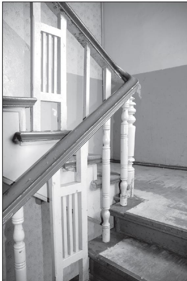
Balustrada głównej klatki schodowej