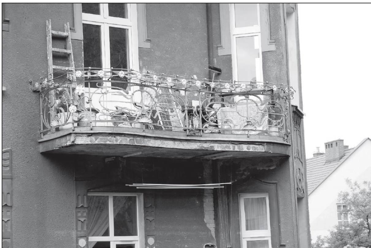
Balustrada balkonowa domu od ul. Drzymały (3 piętro) wykonana w nieznannej pracowni ślusarskiej