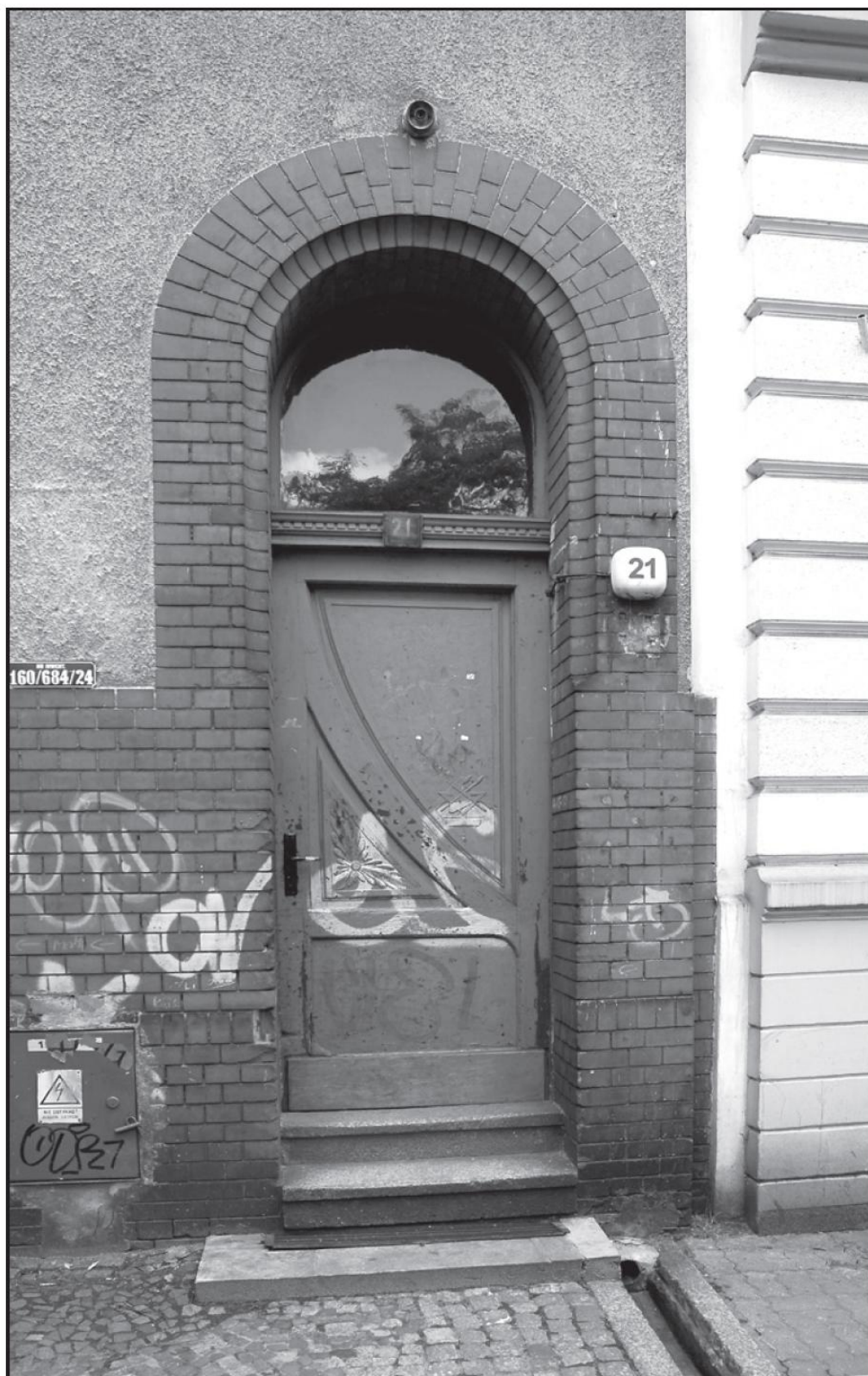
Boczne drzwi z płycinami zdobionymi płaskorzeźbą i nadświetlem