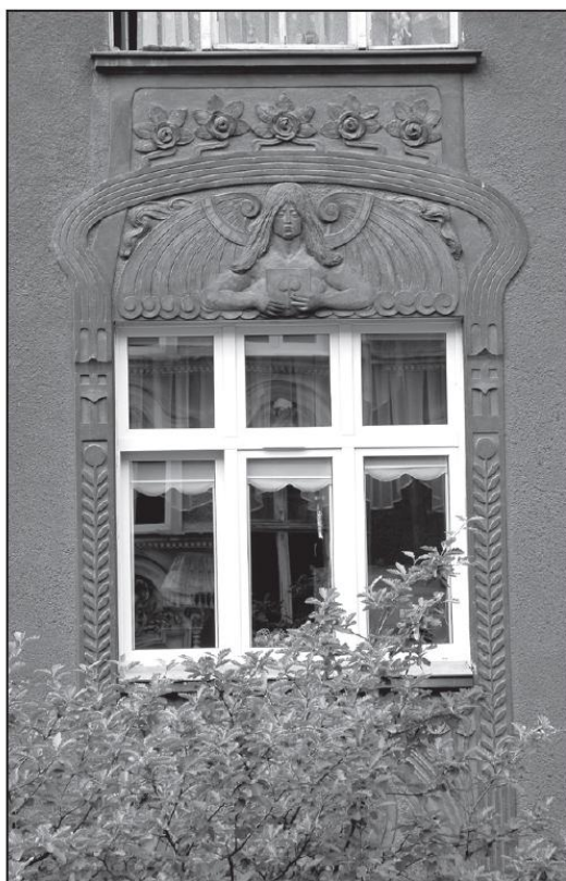
Fragment reliefowej dekoracji górnej partii elewacji domu od strony ul. Drzymały