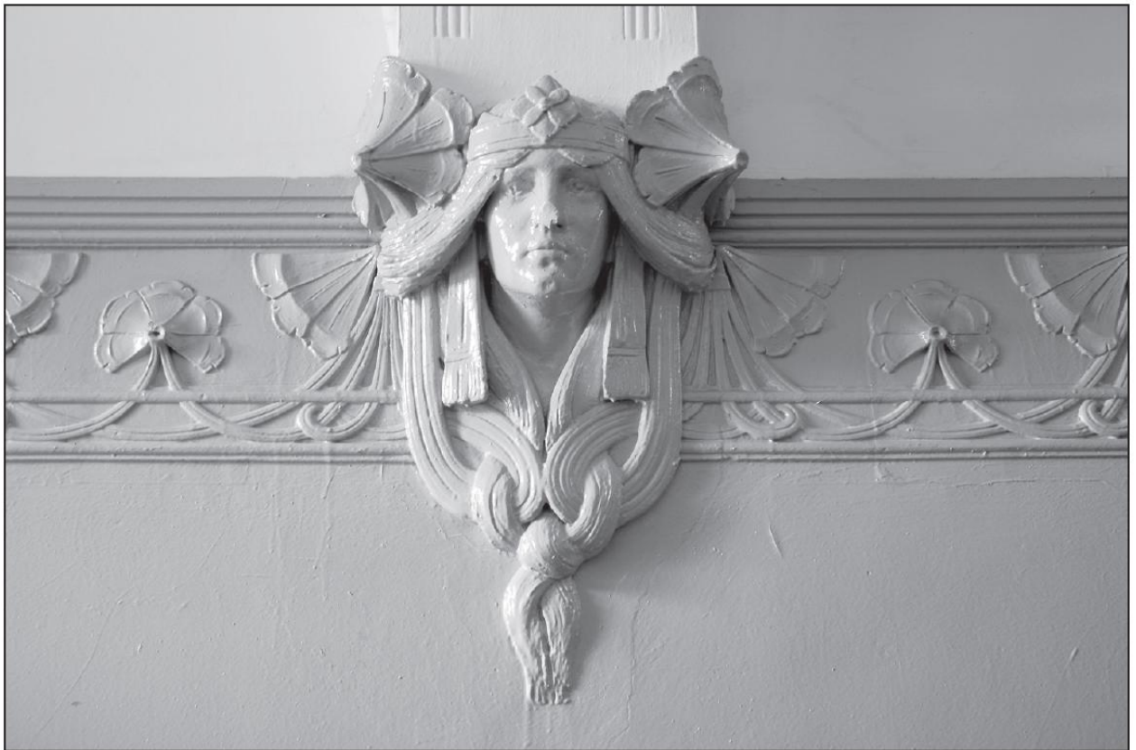
Dekoracja stiukowa w sieni klatki schodowej domu, fragment