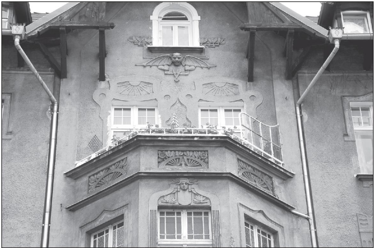
Fragment reliefowej dekoracji górnej partii fasady domu przy ul. Łokietka 21