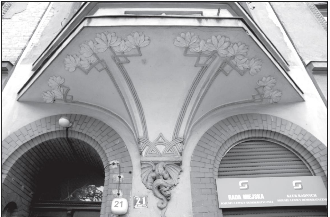
Fragment dolnej dekoracji wykusza ze wspornikiem w kształcie szczydlatego smoka od strony ul. Łokietka