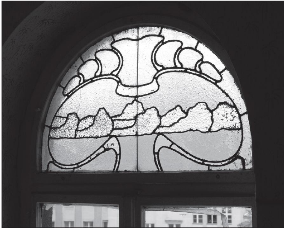
Witraż z motywem chmur w klatce schodowej budynku, 1903